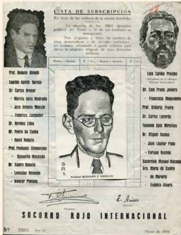
Фото № 11.

РГАСПИ. Ф. 539. Оп. 3. Д. 393. Л. 56. (См. фото № 11)