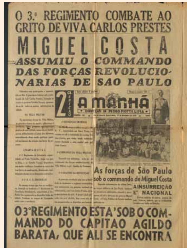
Фото № 9, 10.