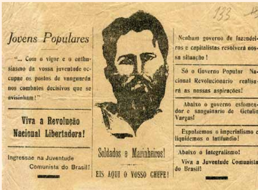
Фото № 4.

арестованных забастовщиков! Прекратить увольнения и высылку национальных и иностранных рабочих! Да здравствует борьба всех эксплуатируемых и угнетённых!