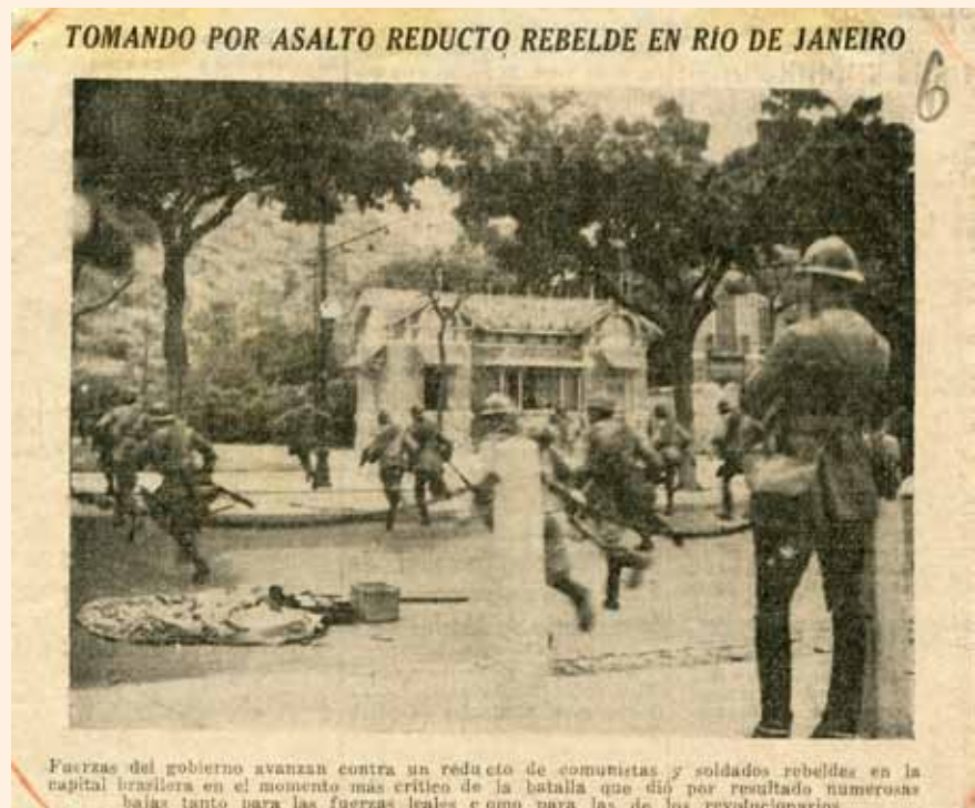
Фото № 8.

Все восставшие силы в Рио, как и по всей стране, находятся под политическим и военным руководством Луиса Карлоса Престеса. Движение готовилось в течение некоторого времени. События на севере Бразилии, вызвавшие революционный взрыв побудили Престеса отдать приказ, который