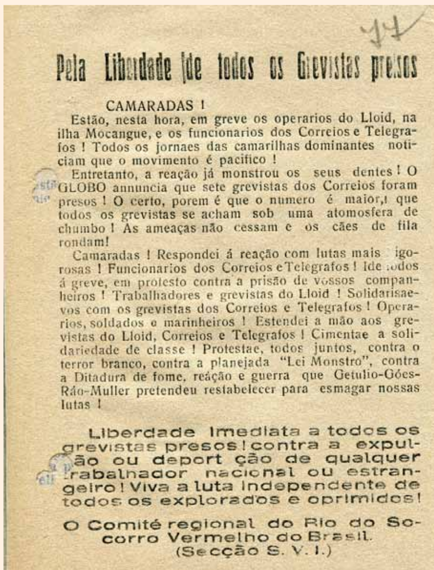
Фото № 5.

Солдаты атакуют позиции мятежников в Рио-де-Жанейро. Правительственные войска двинулись против редута коммунистов и восставших