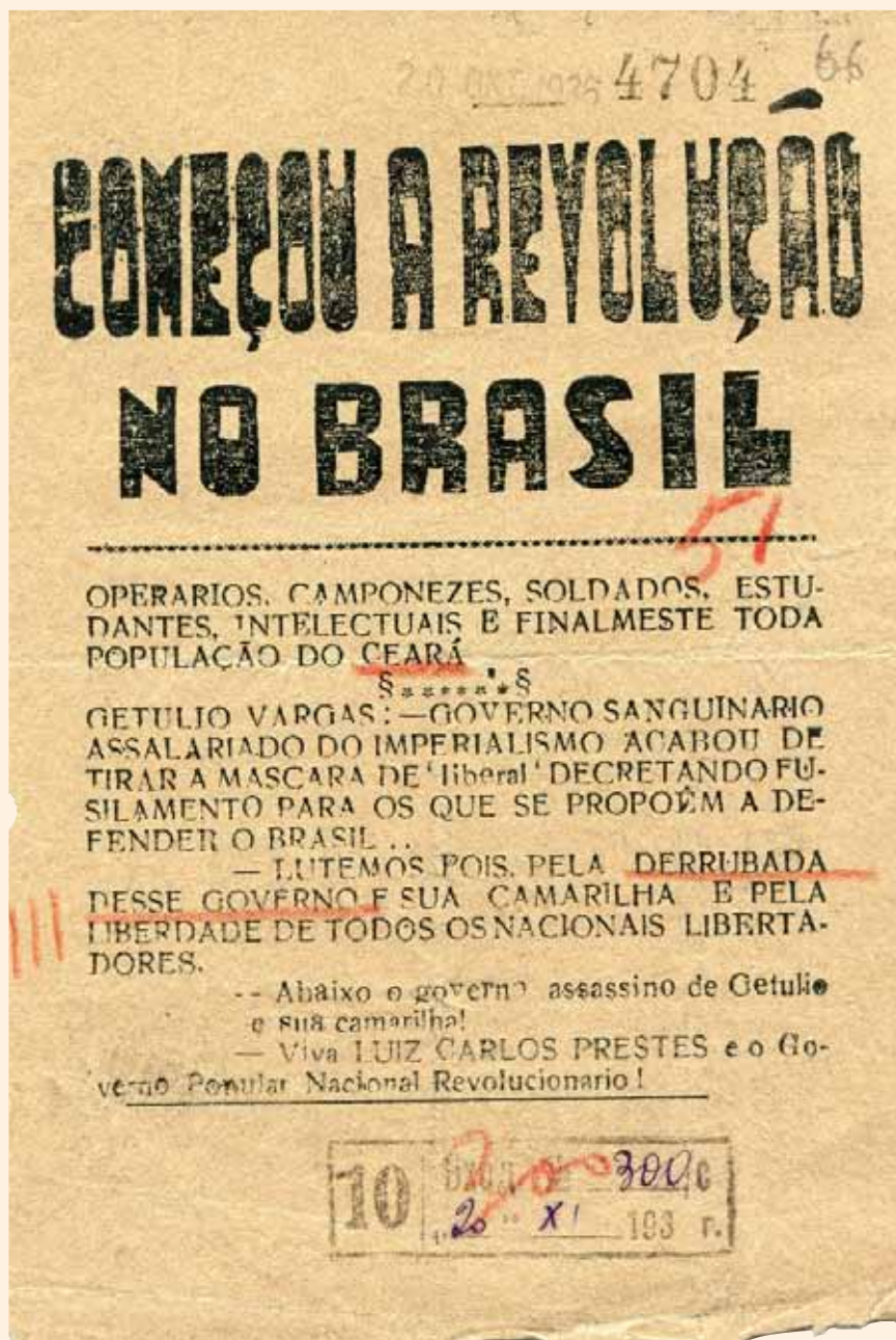
Фото № 1.

Работники умственного и физического труда!