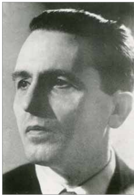
Луис Карлос Престес.